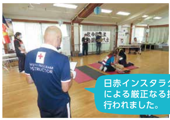
日赤インストラクターによる厳正なる採点が行われました。