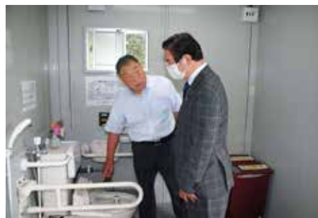
林外務大臣・山本ひろし元厚生副大臣も視察に来られました