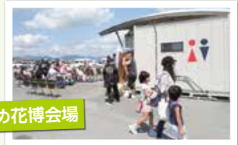
山口ゆめ花博会場