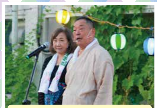
林外務大臣夫人も来られました