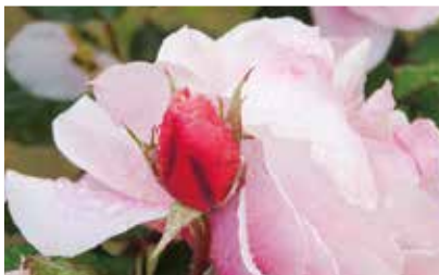
ホホワイトクイーンエリザベス