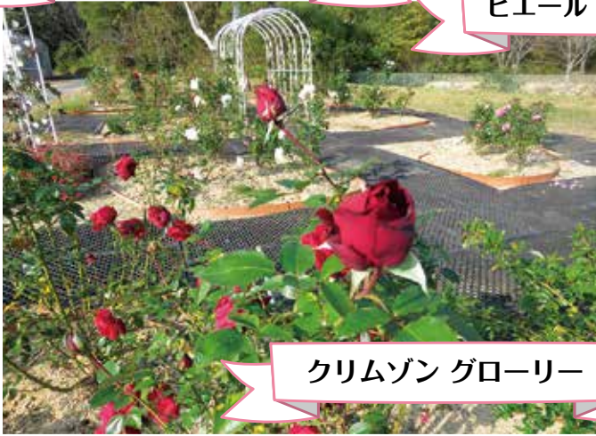
クリムゾン グローリー