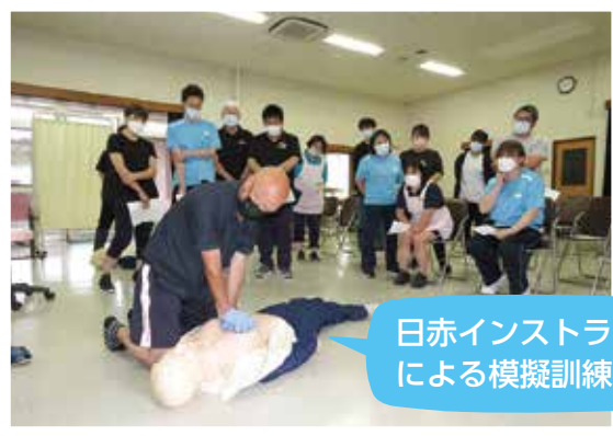
日赤インストラクターによる模擬訓練です。