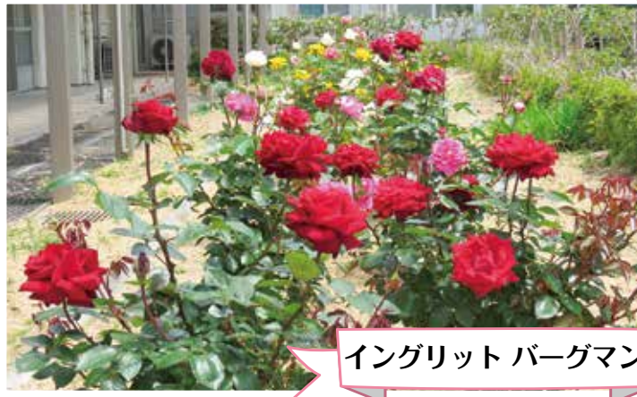
イングリット バーグマン

開園40周年記念事業の薔薇園は、5月と11月の二回満開を迎え、利用者さんの目を楽しませてくれました。丹精込めて育てますので、面会の折には利用者さんと一緒にお楽しみください。