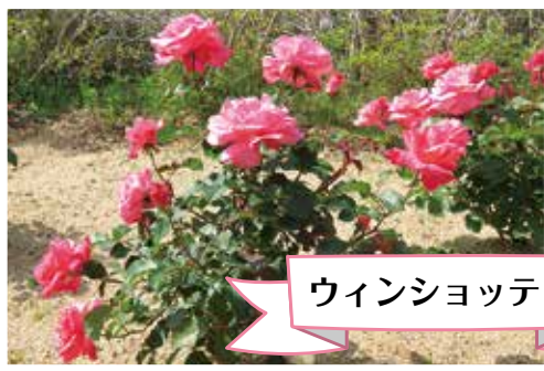
ウィンショッテン