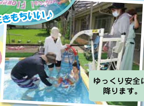
ゆっくり安全に 降ります。