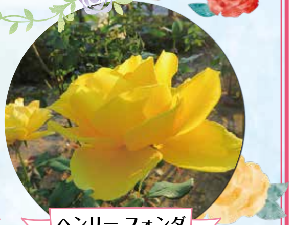
ヘンリー フォンダ