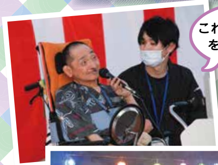
これから夏まつり をはじめます。