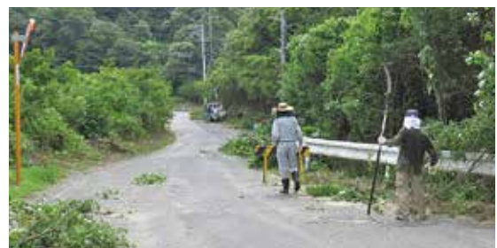
道にはみ出した木の伐採をしました。

七月二十二日に高嶺園・宇部くるみ園・自治会で市道から施設に入る道の両側にある木の伐採を行ないました。 自治会の方に協力して頂いたおかげで大きい車両も通りやすくなり、たいへん助かっております。 常日頃から我々職員は利用者さんに「ふつうの生活」を送って頂くために心配りをしておりますが、我々の仕事も他の方々からの協力があつて成り立っていることを実感しました。