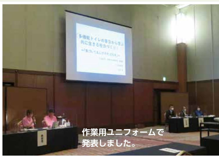
作業用ユニフォームで 発表しました。