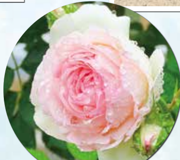
ピエール ドゥ ロンサル